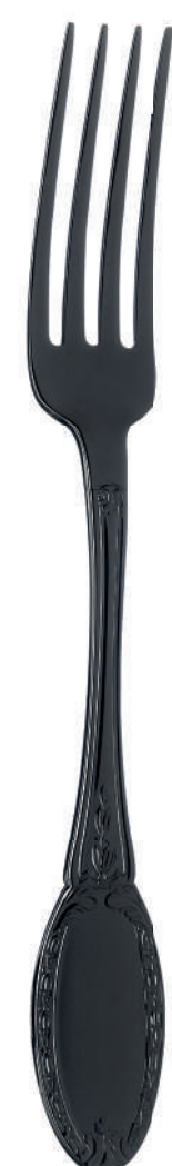
Nero assoluto Lucido