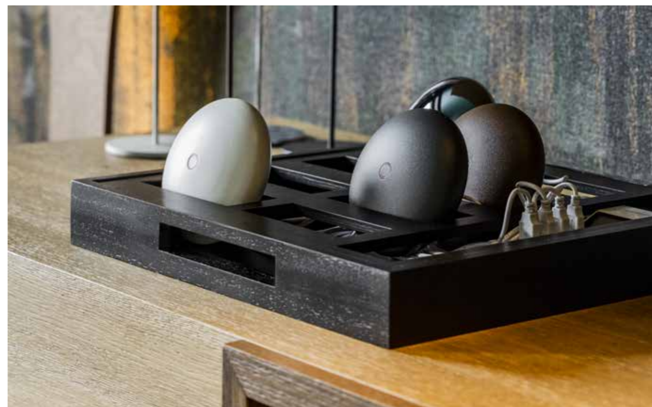
Vassoio Portalampane Nuvola 8 posizioni

Un elemento dalla comodità innovativa, che consente di ricaricare singolarmente il diffusore dopo averlo facilmente rimosso. Grazie all'ingombro ridotto, il vassoio può ospitare fino a 8 lampade per una carica multipla ancora più efficiente.