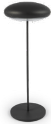
Nuvola Antracite 411 02 17 001