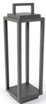
Resort Grigio scuro