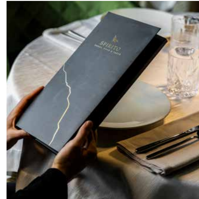
Spirito Menu cartonato personalizzabile a richiesta Cod. 413 00 MENU