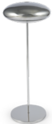
Nuvola Acciaio 411 05 17 001