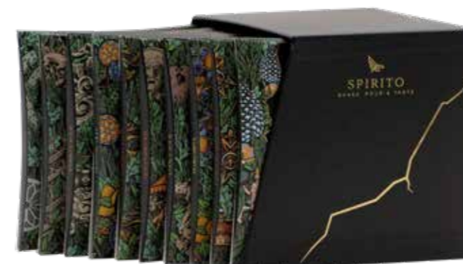
Spirito Box Variety 10 gusti assortiti Cod. 413 00 00 B10