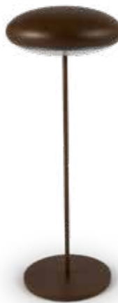
Nuvola Corten 411 03 17 001