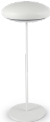
Nuvola Bianco 411 01 17 001